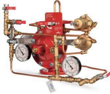
77DE-HRV-PR-MR Manuel Reset

Gövde : Sfero Döküm-GGG50 Bağlantı Şekli : Flanşlı-ISO veya ANSI Maks. Çalışma Basıncı : 300 psi-21 bar Maks. Çalışma Sıcaklığı : 80 °C