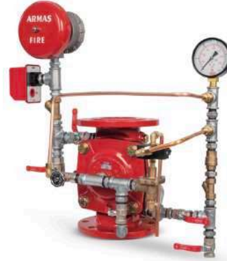
67DE-EL-AL Full Trim Set