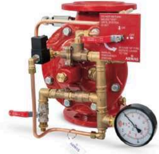
77DE-EL-RR Remote Reset