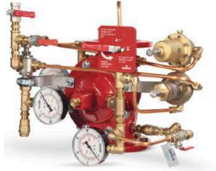
77DE-PORV-PR-MR Manuel Reset

Gövde : Sfero Döküm-GGG50 Bağlantı Şekli : Flanşlı-ISO veya ANSI Maks. Çalışma Basıncı : 300 psi-21 bar Maks. Çalışma Sıcaklığı : 80 °C