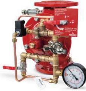
77DE-EL-MR Manuel Reset

Gövde : Sfero Döküm-GGG50 Bağlantı Şekli : Flanşlı-ISO veya ANSI Maks. Çalışma Basıncı : 300 psi-21 bar Maks. Çalışma Sıcaklığı : 80 °C Solenoid : 2/2 Way N.C. Solenoid 24V DC