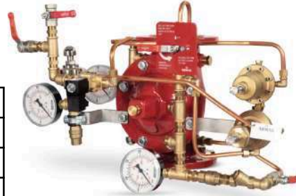
77DE-EL-PORV-PR-MR Manuel Reset