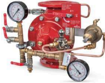
77DE-PN-MR Manuel Reset

Gövde : Sfero Döküm-GGG50 Bağlantı Şekli : Flanşlı-ISO veya ANSI Maks. Çalışma Basıncı : 300 psi-21 bar Maks. Çalışma Sıcaklığı : 80 °C