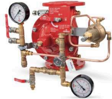
77DE-PN-RR Remote Reset