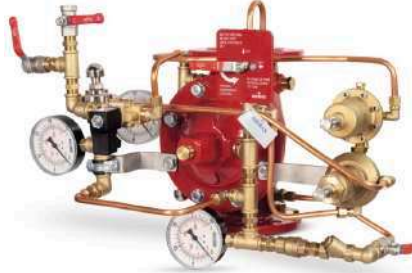
77DE-EL-HRV-PR-MR Manuel Reset