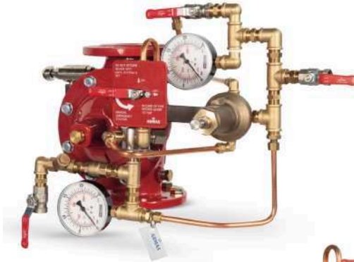
77DE-HRV-MR Manuel Reset