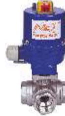
ELEKTRİK MOTORLU KÜRESEL VANALAR ELECTRIC MOTOR BALL VALVE