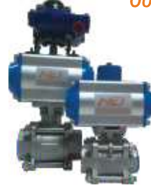
PNÖMATİK KÜRESEL VANALAR PNEUMATIC BALL VALVE