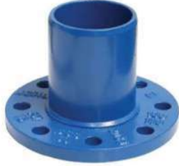
PVC BORULAR İÇİN ( FOR PVC PIPES) GF - GEÇME MUFLU F PARÇASI GF - FLANGED DOVETAILED F