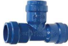
PVC BORULAR İÇİN ( FOR PVC PIPES) G-mmB - GEÇME MUFLU T G-mmB - FLANGED DOVETAILED