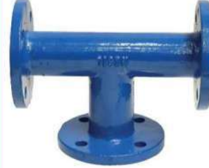
ÜÇ UCU FLANŞLI TE (PT PARÇASI) T PIECES WITH THREE FLANGED ( PTPIECES)