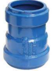
PVC BORULAR İÇİN ( FOR PVC PIPES) G-mmR - GEÇME MUFLU REDÜKSİYON G-mmR - FLANGED DOVETAILED