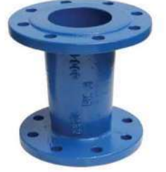
(FFR PARÇASI) İKİ UCU FLANŞLI REDÜKSİYONLAR FFR - REDUCTIONS WITH TWO FLANGED TIPS