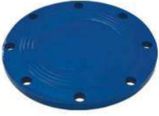
KÖR FLANŞ ( X PARÇASI) BLUNT FLANGED (X PIECES)