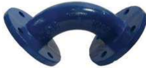
İKİ UCU FLANŞLI DİRSEK (MMG PARÇASI) TIP TWO FLANGED ELBOW