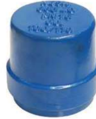
PVC BORULAR İÇİN ( FOR PVC PIPES) GQ - GEÇME MUFLU KÖRTAPALAR GQ - DOVETAILED BUNG