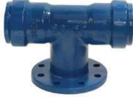
PVC BORULAR İÇİN ( FOR PVC PIPES) G-mmA - GEÇME MUFLU T G-mmA - FLANGED DOVETAILED