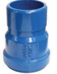
ACP - PVC GEÇİŞ PARÇASI AC - PVC TRANSITION PIECE