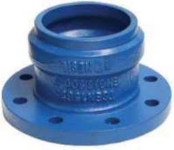
PVC BORULAR İÇİN ( FOR PVC PIPES) GE - GEÇME MUFLU E PARÇASI GE - FLANGED DOVETAILED F